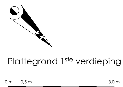
Plattegrond 1 ste verdieping